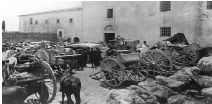
Foules devant le Monastère

C'est pour cette raison qu'on devrait dire à la fin de chaque confession : « Et je confesse tout péché que j'aurais pu avoir oublié et que je n'aurais pas mentionné dans cette confession. »