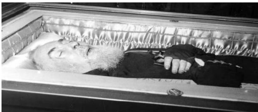
Le corps de Padre Pio, attendant la Résurrection générale au jour du Jugement Dernier

En 1968, quand Padre Pio mourut, il laissa derrière lui un immense hôpital La Maison du Soulagement de la Souffrance , que le New York Times décrivit comme « l'un des plus beaux et l'un des plus modernes et équipés hôpital du monde. » [262] Son héritage comportait également 726 groupes de prières pour un total de 68 000 membres. Il y a aussi vingt-deux centres Padre Pio pour les enfants handicapés et un centre pour les aveugles. Pour donner un exemple de l'influence profonde de sa vie, en 1997, six millions et demi de personnes visitèrent sa tombe. [263]