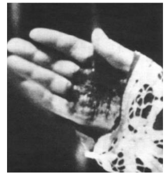
Photo de la main droite stigmatisée de Padre Pio

« ... Je vis apparaître devant moi un personnage mystérieux... du sang coulait de ses mains, de ces pieds et de son côté. Sa vue me terrifia ... La vision du personnage disparaît et je m'aperçois que du sang coule de mes mains, de mes pieds et de mon côté. Imaginez le martyre que j'ai subi et que je continue de vivre presque chaque jour. [8] Du sang continue à couler de la plaie du cœur sans arrêt, notamment du jeudi soir jusqu'à samedi. Mon père, je meurs de douleur à cause de ce supplice et de la confusion qui règne dans mon âme ... Je crierai fort devant lui et je ne cesserai de le supplier : dans sa miséricorde, qu'il éloigne de moi non le supplice ni la douleur – car j'en vois l'impossibilité et je veux m'enivrer de douleur -, mais les marques externes qui sont pour moi source d'une humiliation insoutenable et indicible. » [9]